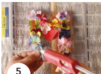
5 花の位置が決まったら、グルーガンで花を貼る。