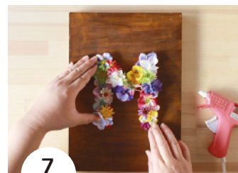
7 印を参考にボードの中央にくるように、5 の裏にグルーをつけて貼る。