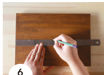
6 ボードの中心に、えんぴつで印をつける。