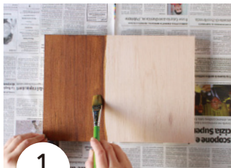
1 木製パネルにペンキ (オイルステイン) で色を塗る。