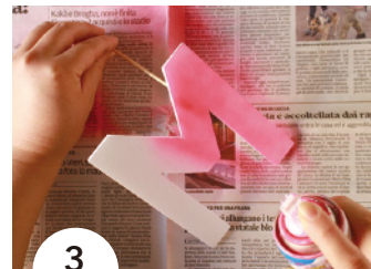
3 切り出したアルファベットの裏から竹串で刺して (貫通しないように注意!)、スプレーのペンキで色をつける。 ※この時側面も忘れずにスプレーしよう