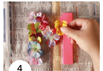
4 3 が乾いたら造花を仮置きしてみる。